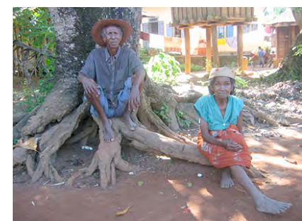
Einwohner von Vohipeno

Besuch einer Schule in Manakara Tagesausflug nach Vohipeno und Besuch des Königs der Antaimoro Abendessen im Restaurant Übernachtung im Hotel Parthenay Club