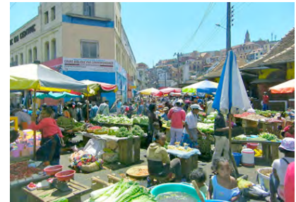
Markt in Antananarivo

Frühstück im Hotel Autofahrt Andasibe – Antananarivo (145 km / ca. 2 Std) Auto zur freien Verfügung in Antananarivo Letzte Möglichkeit zum Shoppen, Fakultatives Programm Day Use Hotel im Stadtzentrum Gemeinsames Abendessen Am Abend Transfer zum Flughafen und Check-In