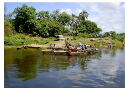
Fähre über einen Fluss

Fahrt mit Geländewagen Nosy Varika - Mahanoro - Vatomandry (ca. 220 km / ca. 9 Std) Unterwegs werden Flüsse mit Fähren überquert Abendessen im Restaurant Übernachtung im Hotel Casa Doro