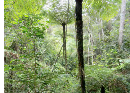
Regenwald bei Andasibe

Frühstück im Hotel Geländewagen und Fahrer zur freien Verfügung in Andasibe Wandertour im Regenwald, Parc nach Absprache Abendessen im Restaurant Übernachtung im Hotel Vakôna Lodge