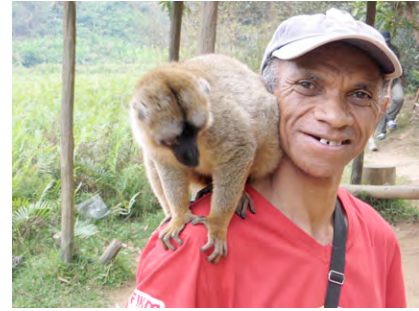
Im Park des Hotels Vakôna Lodge

Frühstück im Hotel Autofahrt Vatomandry – Andasibe (ca. 250 km / ca. 4 Std) Besuch des privaten Reservates des Hotels VAKONA LODGE Abendessen im Restaurant Übernachtung im Hotel Vacôna Lodge