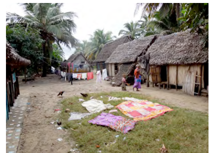
Fischerdorf bei Manakara

Bus zur freien Verfügung Ortsbesichtigung, Besuch des Fischerdorfes von Manakara Abendessen im Restaurant Übernachtung im Hotel Parthenay Club