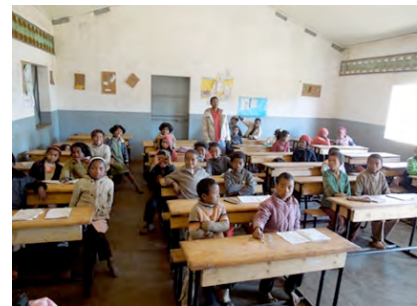
Schulzimmer in Antsirabe