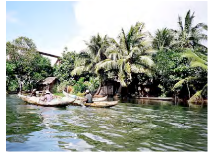
Auf dem Pangalanes-Kanal

Bootsfahrt auf dem Kanal von Pangalanes : Mananjary - Nosy Varika Picknick-Mittagessen Dorfbesichtigungen und kleine Exkursionen unterwegs Abendessen im Restaurant (Vollpension) Übernachtung im Hotel Volazara oder im Zelt (das Hotel hat nur wenige Bungalows)