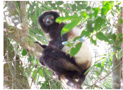
Sifaka in Ranomafana

Wanderung im Regenwaldreservat von Ranomafana Picknick Mittagessen Evtl. Nachtexkursion Abendessen im Restaurant Übernachtung im Hotel Centrest