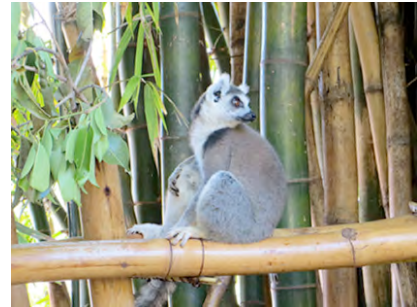
Katta im Lemuren –Park